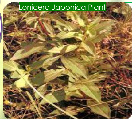
Lonicera Japonica Plant

При низкой дозе MIC и Challenge Tests 0.125% поддерживают заявления “Не содержащий Консервантов” и “Без Консервантов”